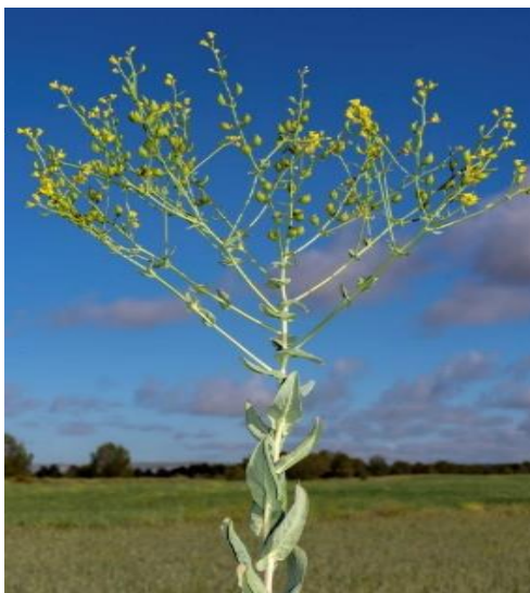
شکل ۲- گیاه کامل علف هرز خردل برگ‌مومی ( Boreava orientalis ) Figure 2. Whole plant of waxy leaved mustard weed ( Boreava orientalis )