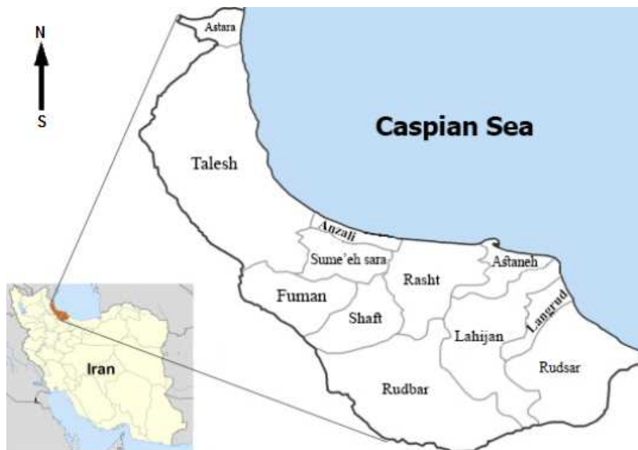
شکل ۱- موقعیت جغرافیایی منطقه تحقیق (املش شرق استان گیلان، شمال ایران) Figure 1. Map of the studied area (Amlash in the east of Guilan province, north of Iran)

این تحقیق در منطقه املش از شهرستان‌های واقع در شرق استان گیلان انجام شد (شکل ۱). بر اساس آمار سازمان جهاد کشاورزی استان گیلان، ۲۵۰۰ هکتار از ۳۵۰۰ هکتار اراضی شالیکاری شهرستان املش (در حدود ۷۰ درصد از کل شالیزارها) از سال ۱۳۸۰ تا ۱۳۹۵، تحت پوشش طرح تجهیز و نوسازی قرار گرفته‌اند. این در حالی است که حدوداً ۳۰ درصد از کل اراضی شالیکاری در این منطقه، به دلایل مختلف، قابلیت تجهیز و نوسازی ندارند. بنابراین، اجرای طرح تجهیز و نوسازی در اراضی شالیکاری منطقه مورد تحقیق، عملاً به اتمام رسیده است. طبق آمار موجود، تعداد بهره‌بردارن بخش‌های شالیکاری تجهیز شده و تجهیز نشده نیز به ترتیب ۳۵۸۰ و ۱۴۲۰ بهره‌بردار هستند